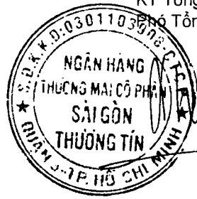
KT Tổng Giám Đốc Phó Tổng Giám Đốc